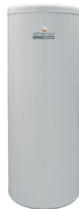
Depósito acumulador ACS