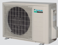
RXS-L / L3