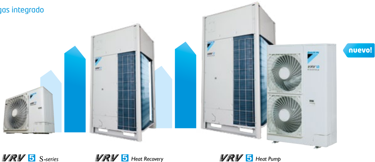
VRV 5 S-series